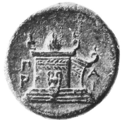
Abb. 2: Bronzemünze aus Parion, Rückseite mit Altardarstellung, zweite Hälfte 4. Jh. v. Chr. oder später

4 Die bisher vorgebrachten zeitlichen Eingrenzungsversuche kreisen um drei Möglichkeiten: Als Beleg für eine Errichtung in der zweiten Hälfte des 4. Jh. v. Chr. wurden entsprechend datierte parianische Münzprägungen geltend gemacht, auf deren Rückseite in Dreiviertelansicht ein Altar mit Stufenbasis und stark akzentuierten Voluten erscheint (Abb. 2) 12 . Eine Datierung ins 3. Jh. v. Chr. erfolgte mit Verweis auf den Altar Hierons II. in Syrakus, unter der Annahme, eine ähnliche Größe deute auf ähnliche Entstehungszeit hin 13 . Ein hochhellenistisches Entstehungsdatum wurde aus der punktuell bezeugten Förderung Parions durch die Attaliden abgeleitet 14 . Letztlich muss das gesamte zeitliche Spektrum in den Blick genommen werden: Auf ein Entstehungsdatum ab dem 4. Jh. v. Chr. deutet zwar nicht allein die schiere Größe, aber die überlieferte aufwändige Ausstattung des Altars hin, die ihn in die Gruppe der sogenannten Prunkaltäre einordnen würde 15 . Ebenfalls als gesichert kann eine Existenz spätestens in der Mitte des 2. Jh. v. Chr. gelten: In diese Zeit datieren Tetradrachmen aus Parion, die auf der Rückseite Apollon Aktaios zeigen 16 . Dessen Kult kann erst im Zuge der Altarerrichtung nach Parion verlegt worden sein, wie aus der Seltenheit dieser Kultepiklese in Verbindung mit einer zweiten Erwähnung des Altars in Strabons Geographika ersichtlich wird 17 .