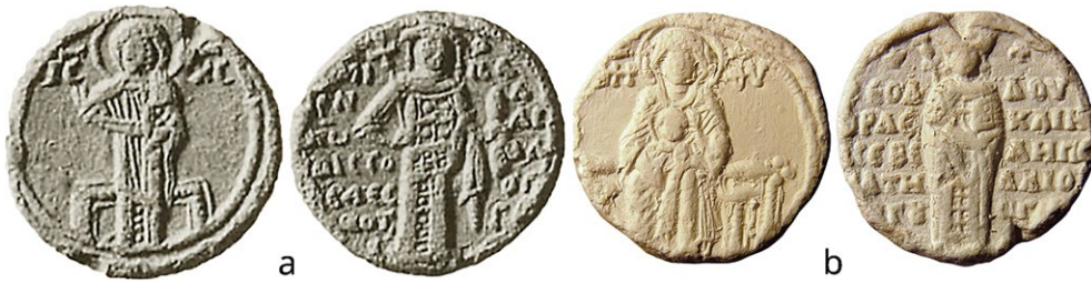
Abb. 4: Bleisiegel des Michael VIII. (a) bzw. der Theodora (b), gefunden in Pergamon. Beschreibung unter FvP 80260 und FvP 68815 . (Maßstab 1 : 1)