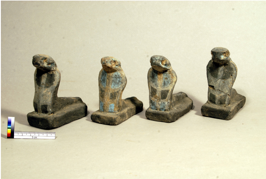
13 Vier Kobrastatuetten aus ungebranntem Nilschlamm nach der konservatorischen Reinigung.