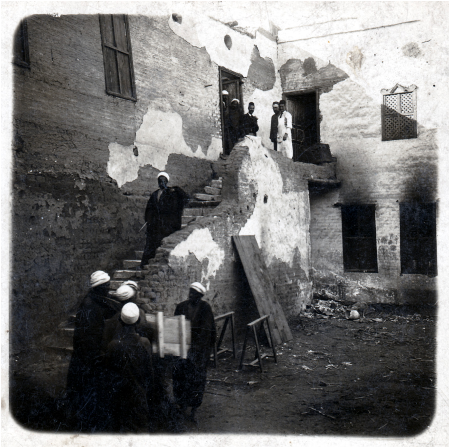
14 Ansicht des von 1895–1898 von der Mission Amélineau genutzten Grabungshauses in el-Kherbe; die Rückseite der Fotografie ist beschriftet mit „Cour de notre maison“.

ges Herzgefäß aus der 19. Dynastie, Bild- und Text-Ostraka sowie weiteres Material aus der christlichen Phase.