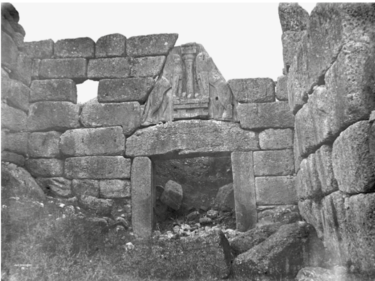
2 Mykene (Griechenland), Reproduktion einer Aufnahme des Löwentors.

wird einer der ältesten Komplexe der Fotothek neu untersucht, ausgewertet und in übergeordnete mediengeschichtliche Kontexte eingeordnet. Eine erste Schenkung von Abzügen durch den Fotografen Paul des Granges erfolgte bereits im Jahr 1878 und damit drei Jahre bevor erstmalig ein eigenständiger Etat zum systematischen Ankauf von Fotografien belegt ist. Da bisher nur an der Fotothek des DAI Rom Originalglasplatten dieses von seinen Zeitgenossen emphatisch gefeierten Fotografen nachgewiesen sind, kommt dem gesamten Komplex „Paul des Granges“ ein gesteigertes fotografiegeschichtliches und medienwissenschaftliches Interesse zu.