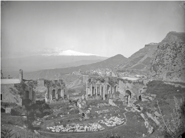
5 Taormina (Italien), Das Theater mit Blick auf den Ätna im Hintergrund.