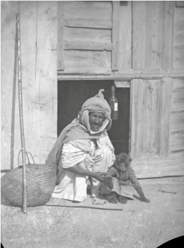
7 Tunis (Tunesien), Genreaufnahme eines alten Mannes mit Affen.