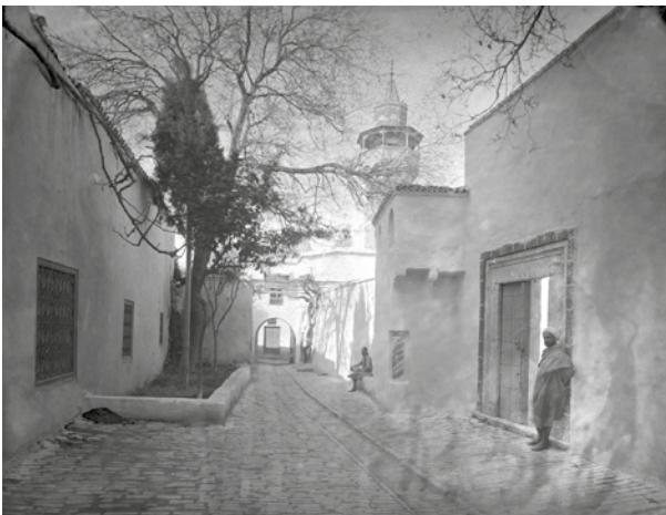
8 Tunis (Tunesien), Straßenszene in der Altstadt mit dem Minarett der Youssef Dey Moschee im Hintergrund.