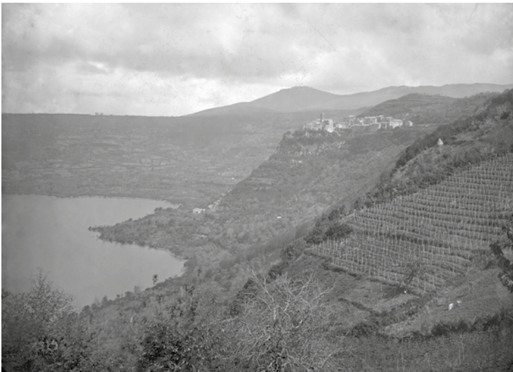
6 Nemi (Italien), Blick auf Nemi und den Nemisee (Foto: D-DAI-ROM-5729, Paul des Granges, DAI Rom).

mit Gruppe 1 entstanden sind. Dazu gehört auch eine Reihe von stereoskopischen Aufnahmen.