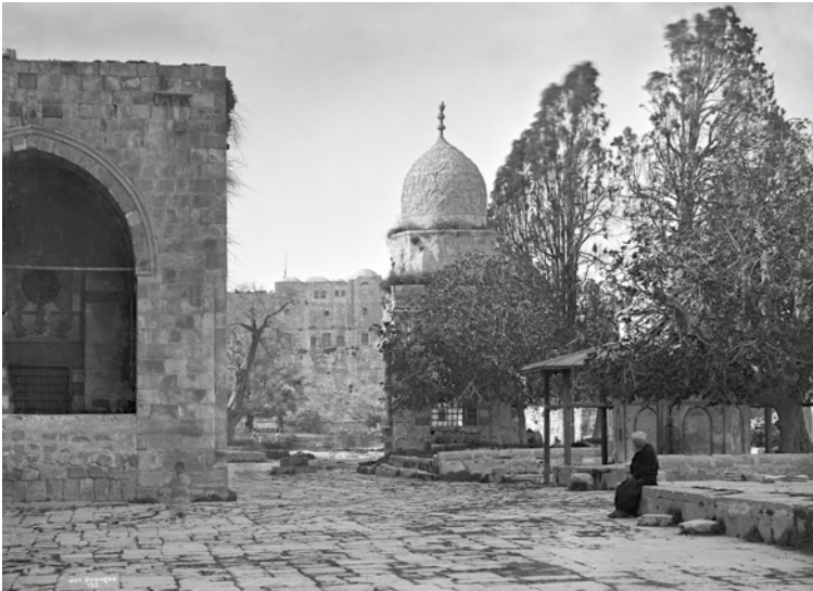
1 Jerusalem (Israel/Palästina), Tempelberg mit dem Sebil Qaitbay-Brunnen und dem Sebil Qasim Pascha-Brunnen (Foto: D-DAI-ROM-2364, Paul des Granges [Nr. 152], DAI Rom).