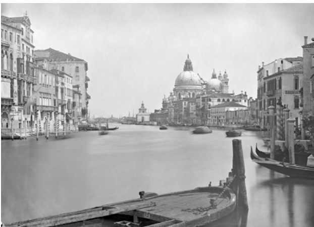
4 Venedig (Italien), Canale Grande mit Blick auf Santa Maria della Salute.

systematische Literaturrecherche vorgenommen sowie einzelne ausgewählte, digitalisierte Fotoarchive durchsucht. Dazu gehören die Sammlung der Albertina in Wien, The Classical Art Research Center der University of Oxford sowie die Sammlungen der Université de Strasbourg und des J. Paul Getty Museums.