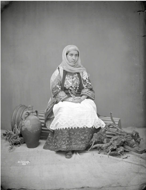
3 Athen (Griechenland), Studioaufnahme einer Frau in traditioneller griechischer Tracht (Foto: D-DAI-ROM-5759, Paul des Granges [Nr. 298], DAI Rom).