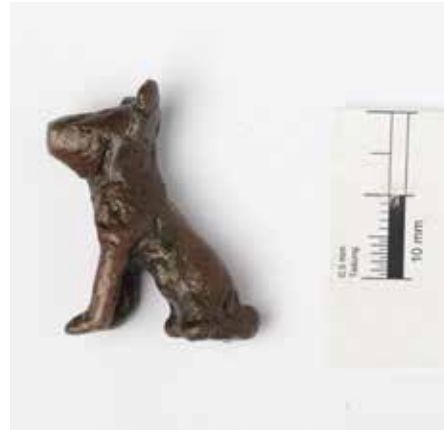
8 Der Kupferhund W 18240 nach der Restaurierung. Er wurde im Eanna-Heiligtum in Uruk gefunden. Hunde sind das Begleittier der mesopotamischen Heilgöttin Gula, die mit einiger Wahrscheinlichkeit eine eigene Cella im Eanna-Heiligtum hatte.