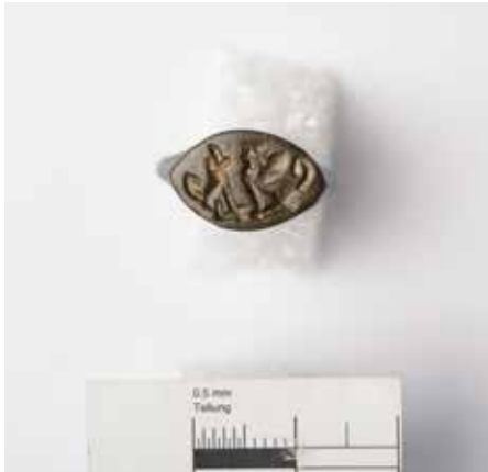
7 Der Bronzering W 20850, gefunden in der Nähe des Gareus-Tempels nach der Restaurierung. Auf der spitzovalen Siegelfläche ist ein Hund und eine Sphinx dargestellt.