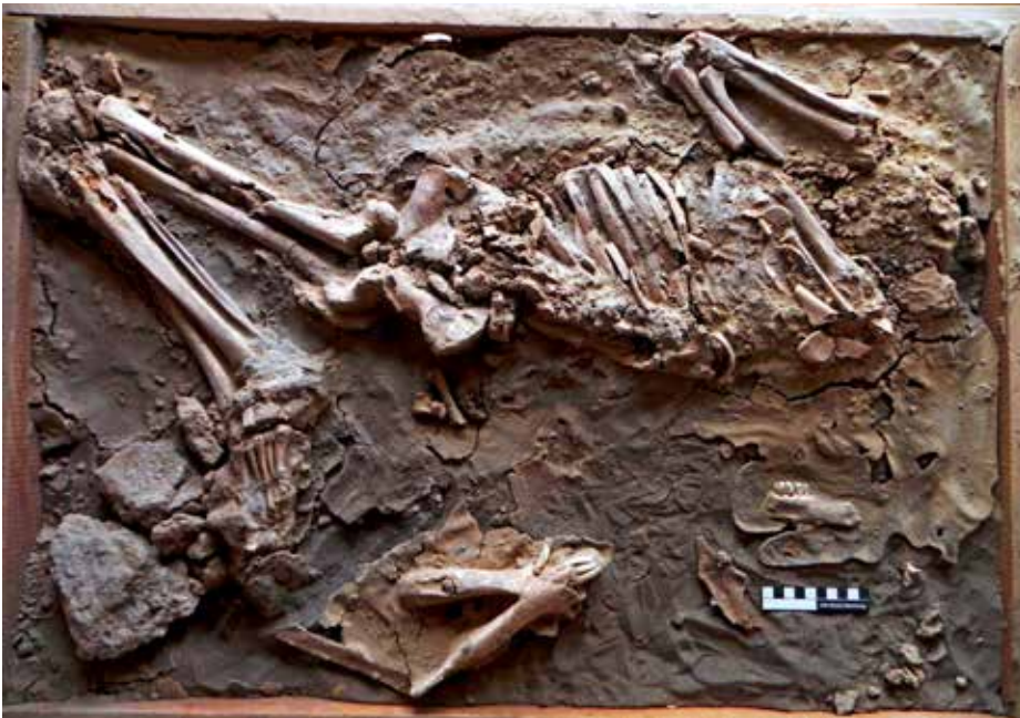
4 Ein im Grabungshaus in Uruk verwahrtes Skelett eines sieben- bis neunjährigen Kindes stammt aus Siedlungsschichten aus dem Ende des 3. Jts. v. Chr. (Foto: E. Petiti).

Als neue wissenschaftliche Unternehmung wurde ein Oberflächensurvey begonnen, mit dem die Stadt von Uruk im Umkreis von bis zu 3 km um die antike Stadtmauer herum kartiert werden soll. In diesem Bereich befinden sich eine Vielzahl von kleinen archäologischen Orten, Produktionsstätten sowie Reste der antiken Infrastruktur – Kanäle, Materialgruben, Gärten und Felder –, die bislang noch nicht im Detail von früheren Surveys erfasst worden sind. Die Forschungen dienen zum einen dem Nachweis der Vorort-Funktionen für Uruk, zum anderen aber auch der Definition von Schutzzonen innerhalb der Pufferzone um den archäologischen Ort herum. Hiermit soll die Planung moderner Nutzungskonzepte unterstützt und gleichzeitig die Anforderungen an einen modernen Umgang mit den archäologischen Hinterlassenschaften definiert werden.