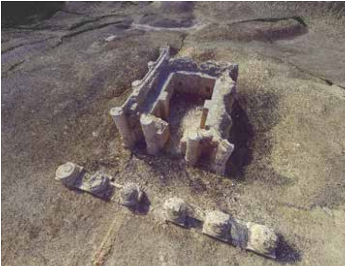
3 Punktwolkenansicht des Gareus-Tempels, erstellt durch die Firma bgis Kreative Ingenieure GmbH.

stand der freiliegenden archäologischen Bauwerke bewertet und Erstmaßnahmen definiert. Der vollständig freistehende Gareus-Tempel (2. Jh. n. Chr.) ist derzeit besonders gefährdet, da die Eckpfeiler zunehmend unterspült sind. Zur konkreten Vorbereitung eines Konservierungsprojekts wurde er mittels terrestrischem Laserscanning erfasst und neben Orthofotos auch ein 3D-Modell gerechnet (Abb. 1–3).