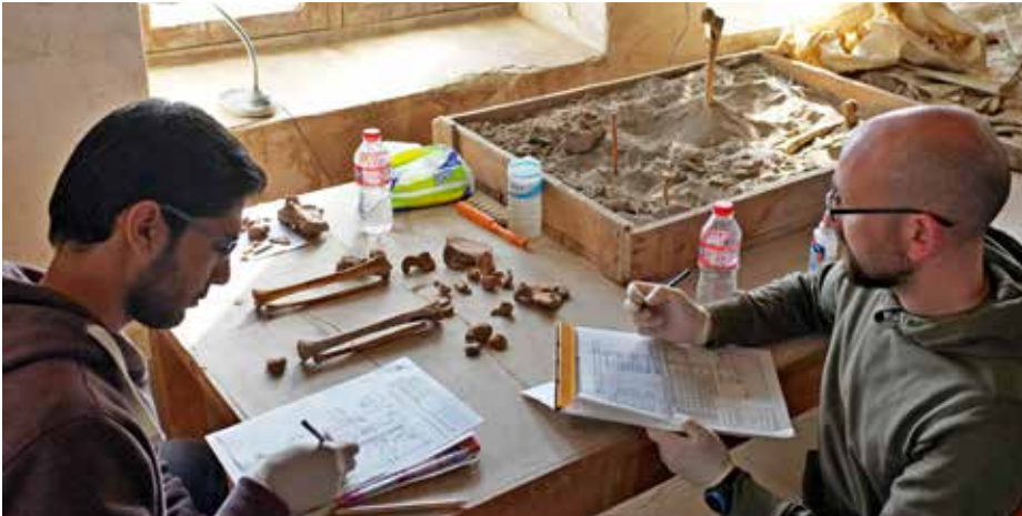
5 Das Kinderskelett wurde im Rahmen einer Fortbildung in paläoanthropologischen Untersuchungsmethoden neu analysiert.