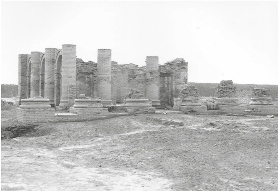
1 Der Gareustempel war zwischen 1970 und 1973 restauriert worden (Bild: O. Griepenkerl).