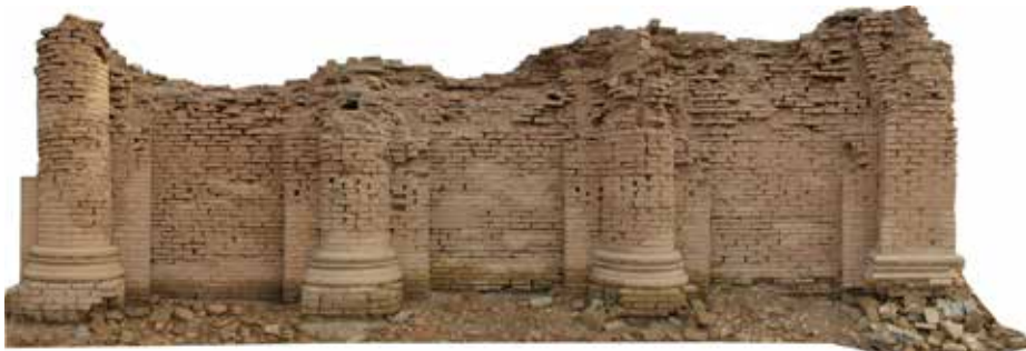
2 Orthophoto der Nordwestseite des Gareus-Tempels. Schäden sind insbesondere an den Eckbastionen des Tempels aufgetreten.

im Irak über viele Jahre hinweg in Uruk neben den Forschungen auch die ständig notwendigen Konservierungsarbeiten unterblieben, wird nun der Fokus zunächst auf diese Maßnahmen liegen.