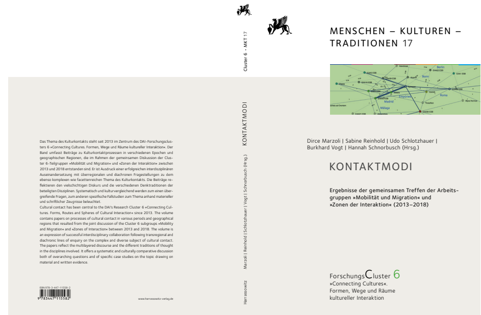
1 Einband »Menschen, Kulturen, Traditionen. Studien aus den Forschungsclustern des Deutschen Archäologischen Instituts 17«. (Grafik: C. Gerlach/DAI)

Arbeitsgruppe 3: Coinage and National Identities in the British Isles, 1066 – c. 1300 (M. Allen); Civic and regional coinage at Elaia (Aiolis), port of Pergamum, and the construct of a common identity in Aiolis, Mysia and Lydia (J. Chameroy); The Levant after Septimius Severus: regional patterns and local identities in the coinage of the oriental provinces (D. Calomino); Metal hoarding practices, pre-monetary exchanges and cultural networks in the North-West of France (13th–5th c. BC) (P.-Y. Milcent); The Shaping Impact of Regional Traditions and Roman Province Borders on Asia Minor's Local Coinage During the Roman Empire (J. Nollé); Identity and regionalism in Iron Age Gaul and Britain (J. Creighton); Creating identities in the post-Roman North-west (H. Komnick); ›...utuntur omnes uno genere nummorum?‹ From division to unity? Sicily and satellite islands (S. Frey-Küpper); Visigoths (R. Pliego); Tokens, coinage and identities in the city of Rome (C. Rowan); Presence and absence of imperial portrait on Roman provincial coins: some thoughts on local, regional and imperial policies (M. Spoerri); Coinage and regionalism in Italy during the Roman conquest (M. Termeer); Regionalism on the coinage of the Late Roman