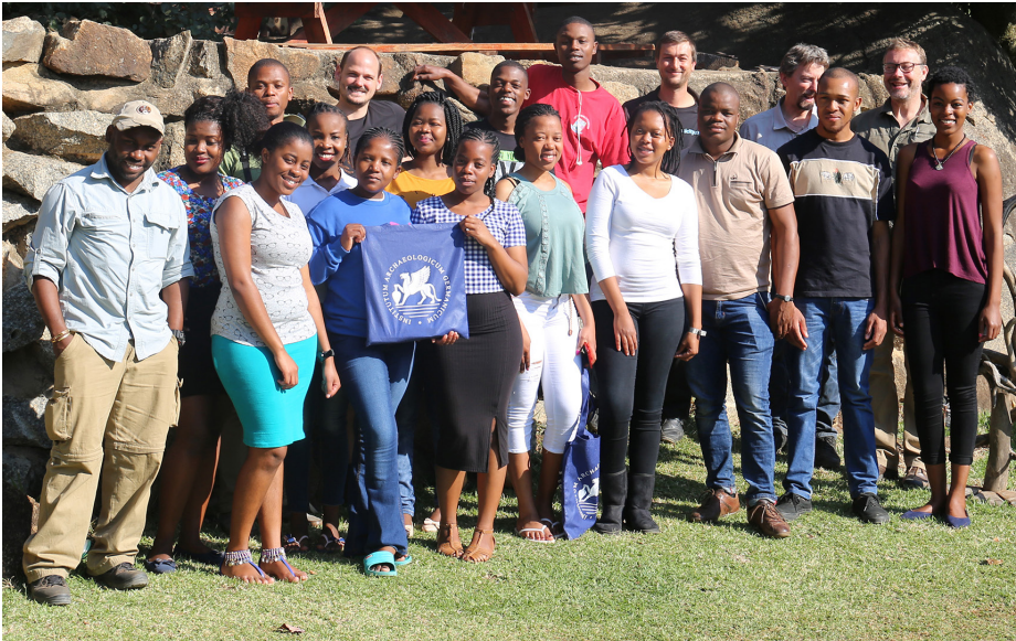
1 Field School mit Studierenden der University of Swaziland (UNISWA) im Juli 2017 (Foto: J. Linstädter).

das gemeinsame Bemühen um die Einwerbung von Drittmitteln sowie die Möglichkeit in einer im Aufbau befindlichen Afrika-Monografien-Reihe zu publizieren. In einer zweiten Sphäre treffen sich einzelne Mitglieder des Netzwerks zur Organisation von Teilprojekten wie etwa zur Vorbereitung des im Oktober 2016 eingereichten DFG-Antrags zur Einrichtung eines Schwerpunktprogrammes (SPP 2143 Entangled Africa) oder dem Projekt zum Aufbau einer Internetplattform zur Vermittlung von Lehrinhalten rund um Archäologie und Kulturerhalt in Afrika (MOOC-Projekt). Eine äußere Sphäre schließt alle individuellen Projekte, finanziert durch DAI, AA oder Drittmittel, ein.