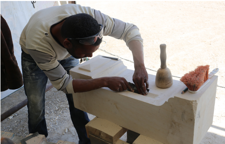
2 Steinmetzausbildung in Bulla Regia.