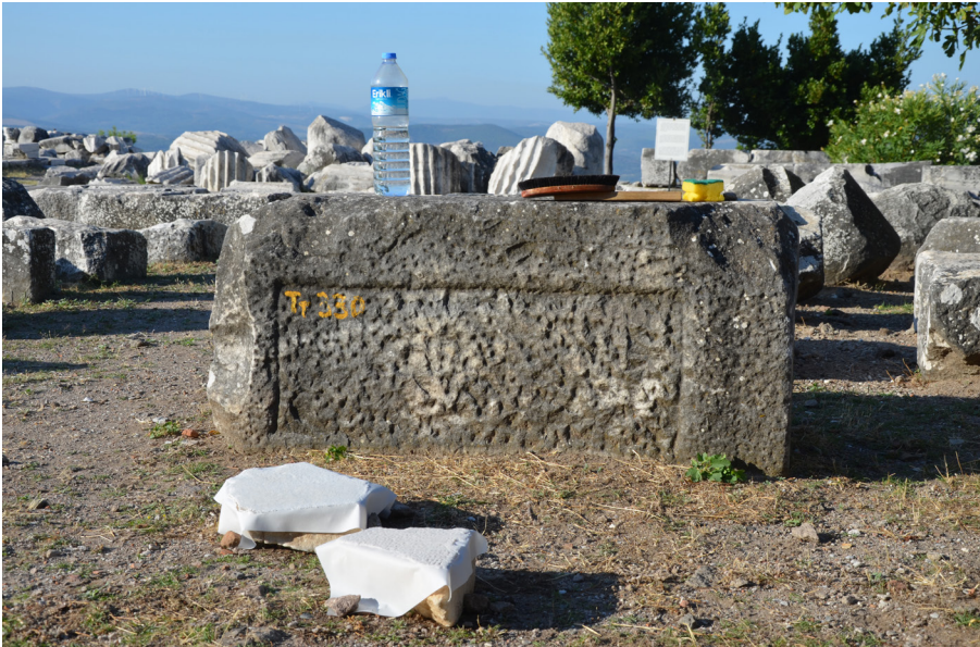
3 Bergama, Türkei. Dokumentation von Neufunden mittels Abklatsch beim Trajaneum auf dem Stadtberg von Pergamon. Im Vordergrund ein Fragment des Dossiers, im Hintergrund Abklatschbürste und Wasserflasche.

Dokumentationslage ist singulär, da die subjektive Richterwahl und Zustimmung zu den Verfahrensbedingungen üblicherweise nicht inschriftlich aufgezeichnet wurden. In der Regel kam nur der richterliche Spruch – der eigentliche Sinn und Zweck des Verfahrens – für eine dauerhafte, öffentliche Präsentation in Frage.