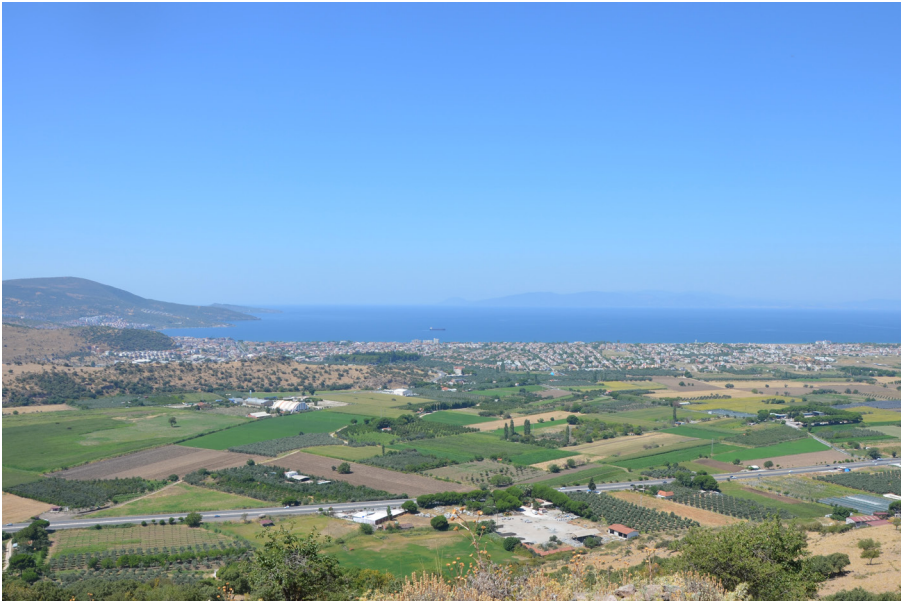
4 Kale Tepe, Türkei. Blick von Atarneus nach Westen. Im Vordergrund die türkische Küstenstadt Dikili, links die Kane Halbinsel, am Horizont die Insel Lesbos mit Mytilene.

setzten. Die Anhörungen beider Parteien fanden vor Ort und über mehrere Tage hinweg statt. Aus der ausführlichen Grenzbeschreibung geht hervor, dass der besagte Landstrich in der Nähe der Polis Atarneus gelegen haben muss, deren Territorium als Endpunkt des Grenzverlaufs diente (Abb. 4). Die historiographische Überlieferung berichtet bereits im 5. Jahrhundert v. Chr. von umfangreichem Territorialbesitz Mytilenes an der gegenüberliegenden kleinasiatischen Westküste, der trotz wechselhaften Verhältnissen bis in späthellenistische Zeit zumindest teilweise aufrecht erhalten werden konnte.