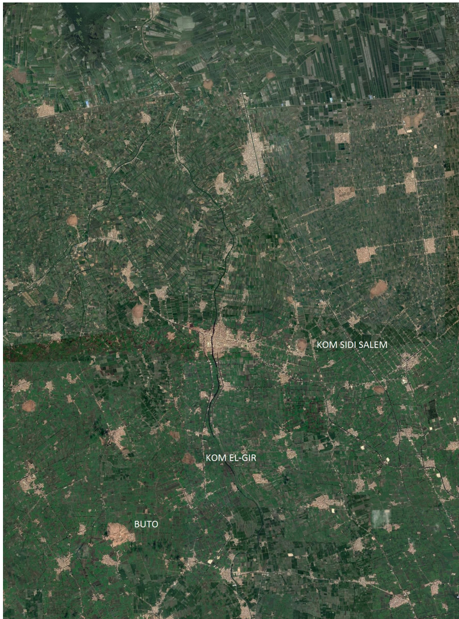
1 Satellitenbild des Untersuchungsgebietes. (Grundlage: GoogleEarth)