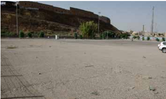
4 Surveyquadrant S102 (Parkplatz mit Kiesschüttung) nordwestlich der Zitadelle.