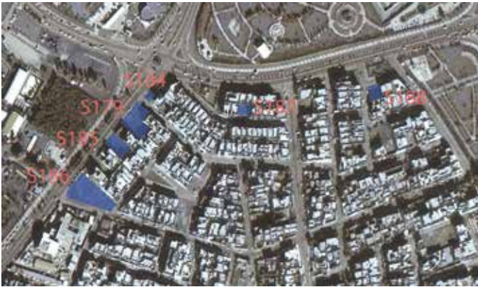
8a Surveyquadranten zwischen 30 m- und 60 m-Road südwestlich des Shanidar-Parks (S179; S184–S188) (Abb.: A. Intilia).