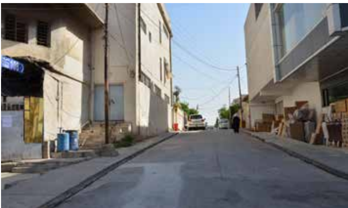
7b Topographische Erhebung nördlich der 60 m-Road.

geeignet bzw. hinreichend war und daher alternative Versorgungsmöglichkeiten erschlossen werden mussten.