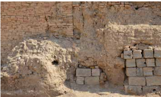
5 Surveyquadrant S154 (Lehmziegelmauer mit Keramikeinschlüssen, Backstein- und Betonschalstein-Mauer).

im Schutt moderner Gebäude zuweilen Überreste rezenter Wassergefäße gefunden, die heute noch verhandelt werden.