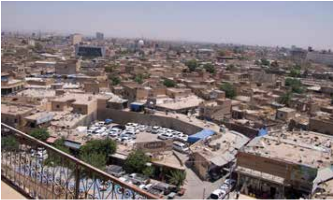
3 Blick auf das Gebiet südöstlich der Zitadelle (im Vordergrund Surveyquadrant 143)