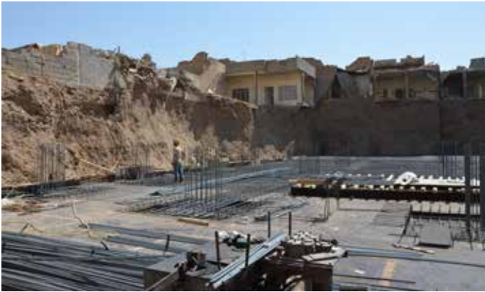
6 Surveyquadrant S122 (Baugrube mit Keramik und Resten von Bestattungen in den Profilwänden).