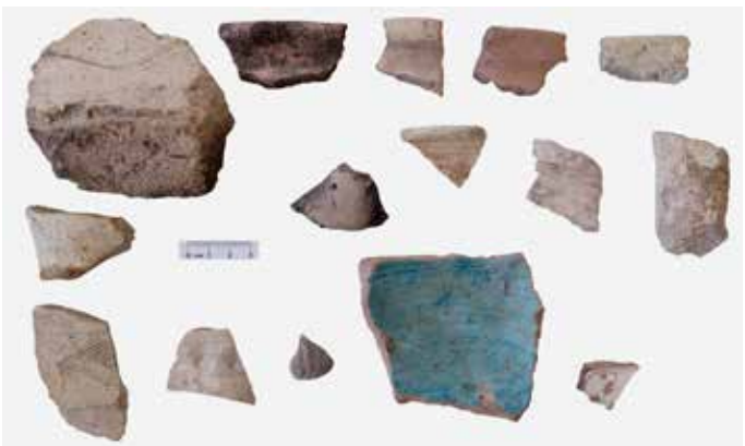
9 Keramik der Eisenzeit sowie der islamischen Perioden aus Surveyquadrant S 112.

dieser Daten ist die Erstellung eines Geländemodells für Erbil vorgesehen, das als Referenz für die künftigen Untersuchungen dient. Gleichzeitig ist die Einbeziehung und Überprüfung der bisher gewonnenen Fernerkundungsdaten im Rahmen des Geoinformationssystems (GIS) des Projekts geplant.