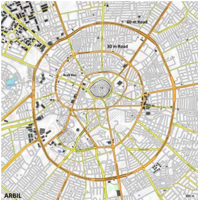
1 Plan mit Lage der 60 m-Road, der 30 m-Road, Zitadelle und dem Gebiet Arab Kon (Karte: openstreetmap.org bearbeitet von A. Hausleiter).