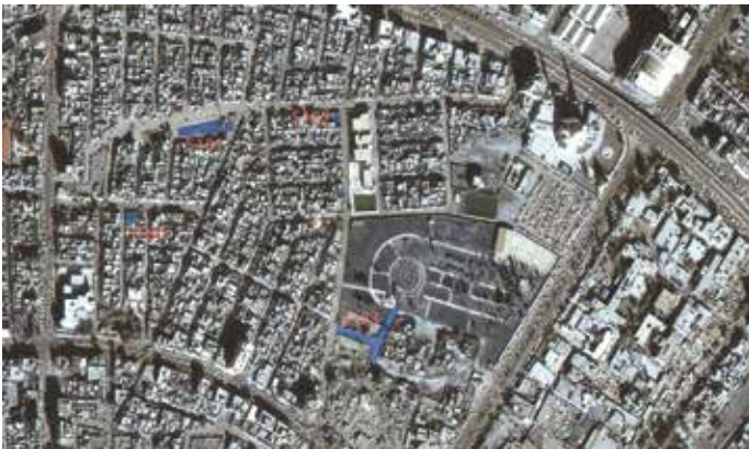
7a Surveyquadranten zwischen 30 m- und 60 m-Road nordöstlich der Zitadelle (S180–S183) (Abb.: A. Intilia).