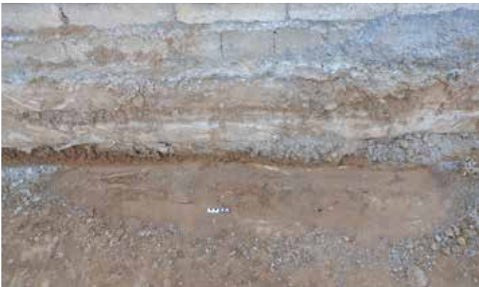
8b Surveyquadrant S188 (Baugrube mit Resten einer Erdbestattung).