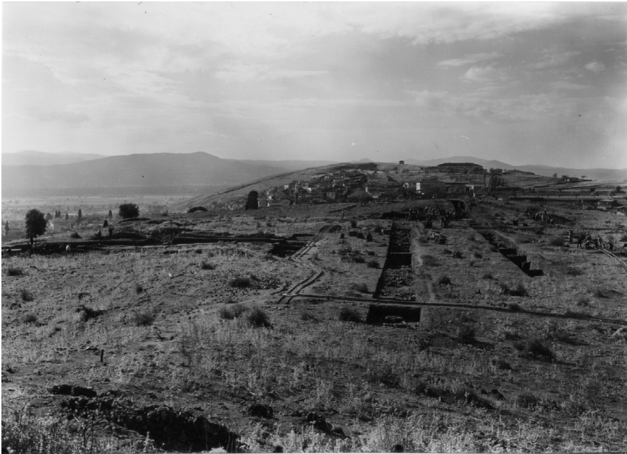
3 Pergamon, Türkei. Der Musalla Mezarlığı während der Ausgrabungen 1957. Blick über die Hügelkuppe aus nördlicher Richtung.

Grabungsinfrastruktur und Logistik sind unbestreitbar. Es fällt jedoch auf, dass die Arbeits- und Dokumentationspraktiken der Boehringer-Zeit in Pergamon von sehr unterschiedlicher Qualität sind.