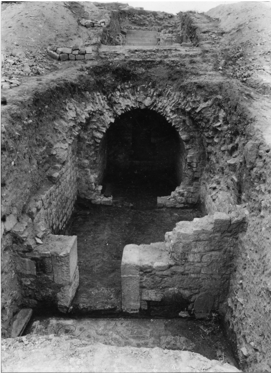
6 Pergamon, Türkei. Das sog. Bodrum am Osthang des Musalla Mezarlığı. Ansicht aus östlicher Richtung.

Raum ist auch der Rest eines Tonnengewölbes erhalten, das ehemals beide Räume überspannt haben muss. Beeindruckend ist ein hochwertiges Bodenmosaik im östlichen Raum des ›Bodrum‹, das im Zentrum eine Szene mit Meerwesen zeigt und aus einer Kombination von Blattrankenfries und symmetrisch angeordneten, figürlichen Motiven gerahmt wird. Wie der ›Saak‹ weist auch das ›Bodrum‹ eine spätere Bauphase auf, die aus einer Zwischenwand mit Tür im östlichen Raum und einem Ofen besteht. Zusammen mit einer oberhalb am Hang liegenden und mit dem ›Bodrum‹ fluchtenden Treppenanlage wird der Komplex als Teil eines römischen Wohnhauses in Hanglage interpretiert. Die Nische in der Rückwand des hinteren Raumes verleitete die Ausgräber zu einer Interpretation als Privatheiligtum oder Kultraum. Der zu einem späteren Zeitpunkt eingebaute Ofen deutet auf eine mögliche Umnutzung des Raumes hin, ohne dass diese derzeit näher datiert werden könnte. Wie bereits erwähnt, könnten der ›Saak‹ und das ›Bodrum‹ zu ein und demselben Gebäude gehört haben.