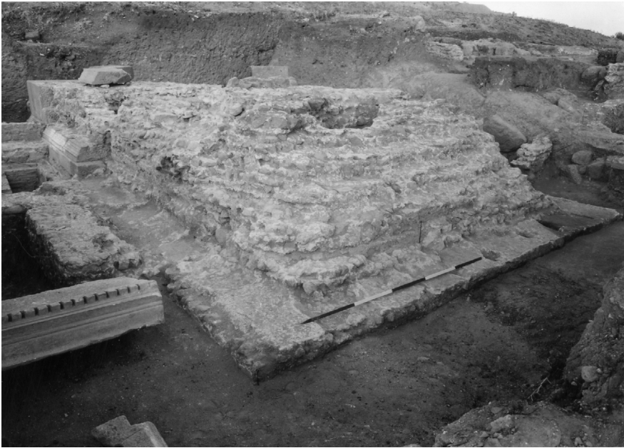
8 Pergamon, Türkei. Das Podium des Grabtempels. Ansicht aus südwestlicher Richtung.