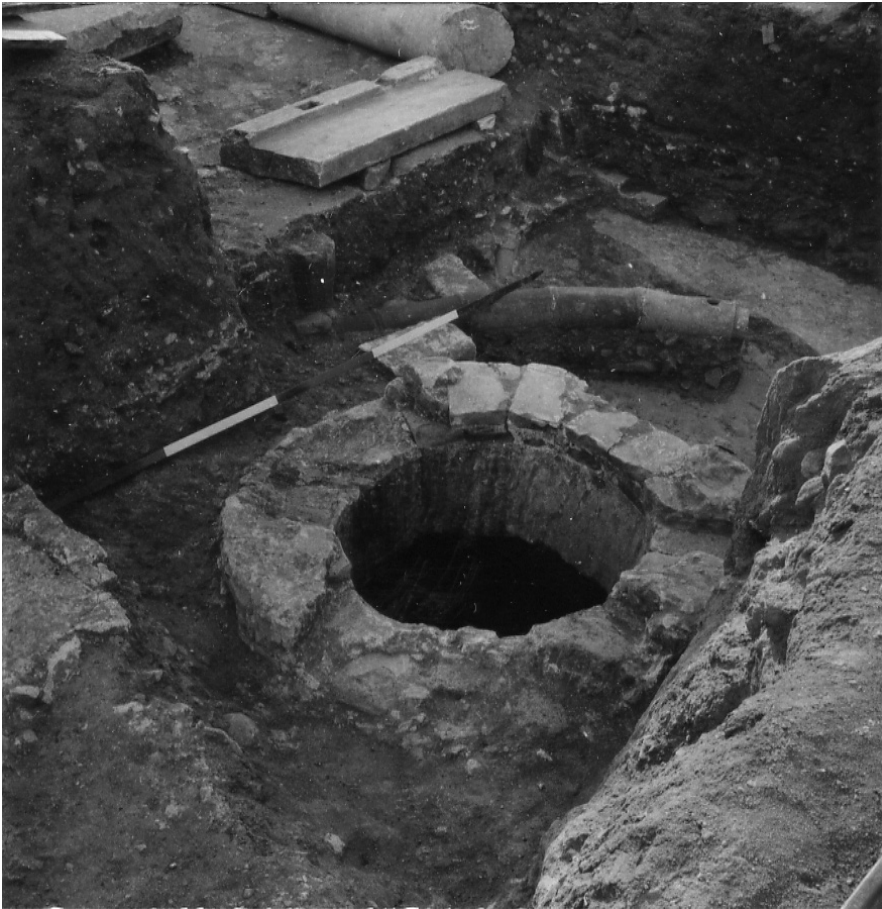
7 Pergamon, Türkei. Zisternenöffnung im Hofhaus am südlichen Abschluss des Musalla Mezarlığı.

räumlich von der nördlichen in die südliche Hälfte des Hügelrückens, wobei methodisch derselbe Ansatz mit Suchschnitten oder Gräben gewählt wurde. Für nochmals drei Monate arbeitete eine wie im Vorjahr immense Anzahl an Arbeitern in der Verlängerung des westlichsten der großen Längsschnitte nach Süden hin sowie in zwei langen Querschnitten. Letztere durchpflügten parallel zueinander liegend in ostwestlicher Richtung die gesamte Breite des südlichen Abschlusses des Musalla Mezarlığı. Die Ausgräber hatten möglicherweise bereits die Hoffnung auf eine Entdeckung des Nikephorion aufgegeben und interessierten sich von nun an besonders für die räumliche Einbindung des römischen Theaters im Süden sowie dessen Datierung.