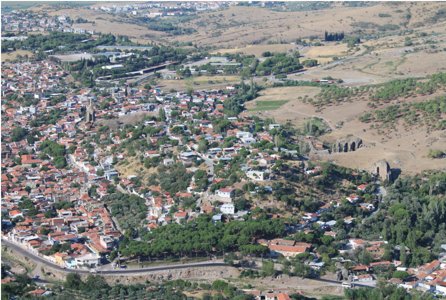
1 Pergamon, Türkei. Der Musalla Mezarlığı in Pergamon. Blick aus nördlicher Richtung von der Terrasse des Trajaneums auf dem Stadtberg.

inserted into the iDAI.field database, an attempt was also made to obtain a quantitative overview of the excavations' excavated find material. The project served as preparation for a larger study possibly a dissertation, on the settlement and research history of the Musalla Mezarlığı and its find material. Due to the global pandemic, the project was worked on from home office.