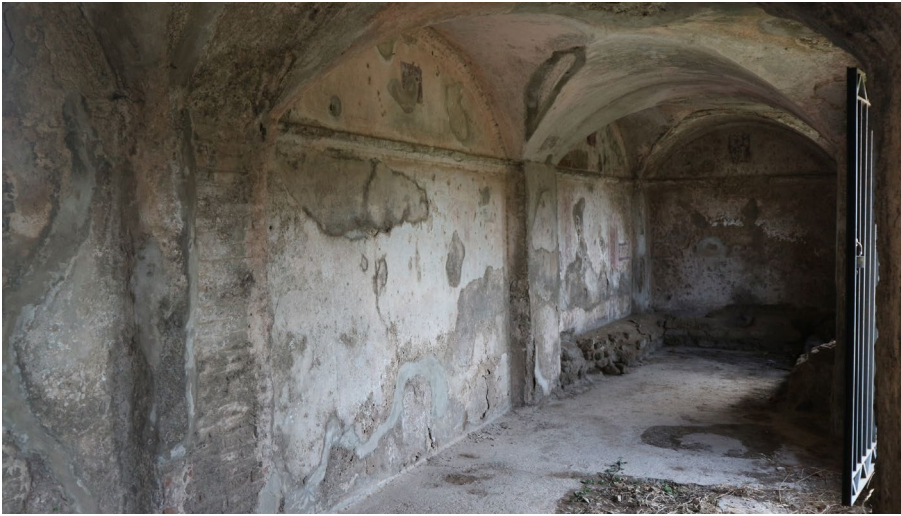
3 Capua, Italien. Ost- und Südwand der sog. Kammer der Gladiatoren.

den Ehrentribünen ( pulvinar ) liegen, auf dem der Spielgeber und die Amtsträger der Stadt saßen. Haben sich von dem Raum auf der Westseite nur die Grundmauern erhalten, so hat der östliche Raum seine Wandbemalung und sein stuckiertes Gewölbe bewahrt (Abb. 3).