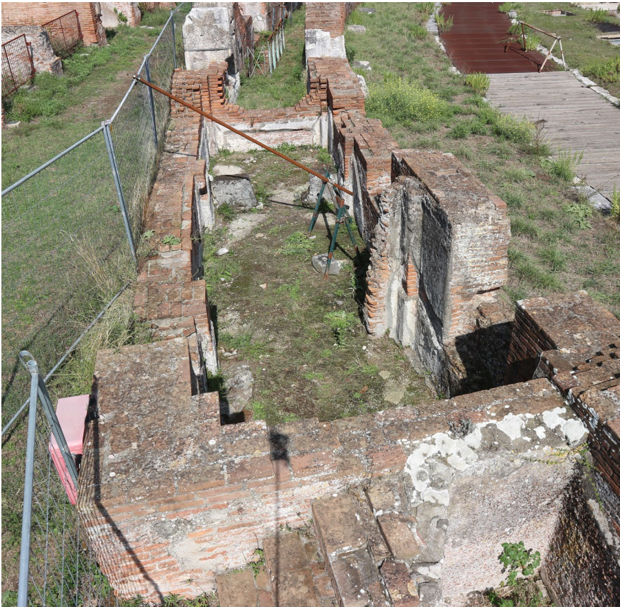
10 Capua, Italien. Zustand der sog. Kammer der Gladiatoren auf der Westseite der Arena.

den Räumen lagen. Speziell in Capua wird der ausgemalte und stuckierte Raum auf der Ostseite als Luxuslatrine bezeichnet [13], obwohl weder eine Wasserzuleitung noch Ableitung vorhanden ist. Überhaupt fehlen solche Voraussetzungen einer Latrine auch in den anderen Räumen.