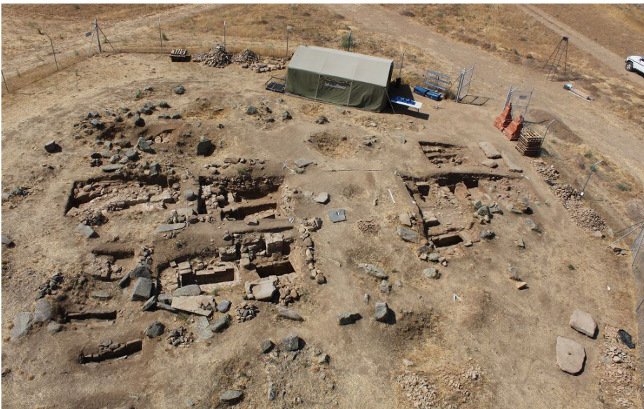
2 Grabungsschnitte im Bereich der Basilika. Rechts die aktuellen Schnitte 03, 11 und 16 im westlichen Teil des Langhauses, mittig die aktuellen Schnitte 02 und 10 im nördlichen Seitenschiff und im Mittelschiff, links die Altschnitte von 1994 im nördlichen Seitenschiff und der Nekropole östlich der Basilika, dahinter unser Schnitt 01 mit dem Südteil der Apsis und dem Ansatz des südöstlichen Annexraumes.

Die Grabungskampagne 2016 war die zweite innerhalb unseres ‚Proyecto General de Investigación‘ und gleichzeitig die letzte, die von der Madrider Abteilung des DAI aus durchgeführt wurde – seit Mitte Oktober 2016 ist das Vorhaben an der Universität Göttingen angesiedelt, und zwar an der dortigen Abteilung für Christliche Archäologie und Byzantinische Kunstgeschichte. Die zweite Projektphase, die für die Zeit von 2017 bis 2020 vorgesehen ist, soll von dort aus betrieben werden.