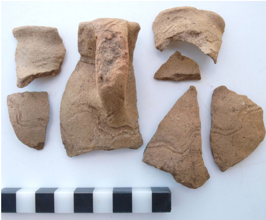
11 Fragmentierter kleiner Krug mit Wellenliniendekor aus Schnitt 13 (Inv.-Nr. Añ16.1305.039).