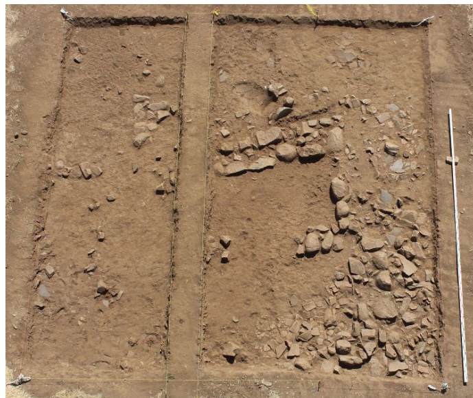
8 Schnitt 13, Planum 1 mit Resten einer Mauersetzung sowie der Versturzschicht aus Dachziegelfragmenten.