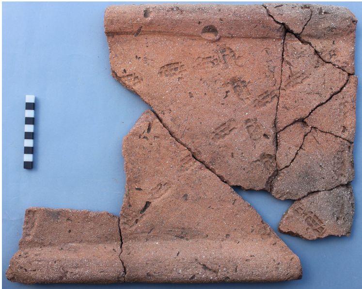
10 Fragmente einer wohl lokal hergestellten tegula mit Stempeldekor aus Schnitt 13 (Inv.-Nr. Añ16.1305.038a).

über die Halbinsel hineingereicht haben. So lässt sich die Chronologie von ‚La Losilla‘ innerhalb des Zeitraumes zwischen dem mittleren 5. und dem ausgehenden 9. Jahrhundert eingrenzen, eine Einschätzung, die auch unsere ersten Datierungen nach der Radiokarbonmethode bestätigt haben: