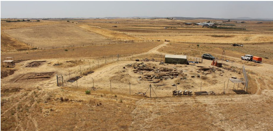
1 Ansicht von Norden mit den Resten der Basilika innerhalb der Umzäunung (Bildmitte) und den Schnitten im Bereich der Profanbebauung südöstlich davon (links).