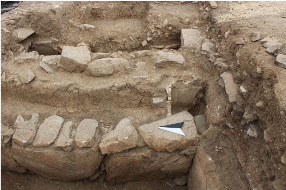
7 Detail der Südostecke von Grab Nr. 10 in Schnitt 11 mit der durch Einbau des Grabes zerstörten Struktur aus opus signinum , vielleicht der Taufpiscina einer älteren Anlage.