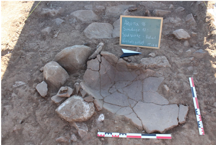
9 Schnitt 13, Planum 1 mit den in situ befindlichen Resten eines fragmentierten Vorratsgefäßes.