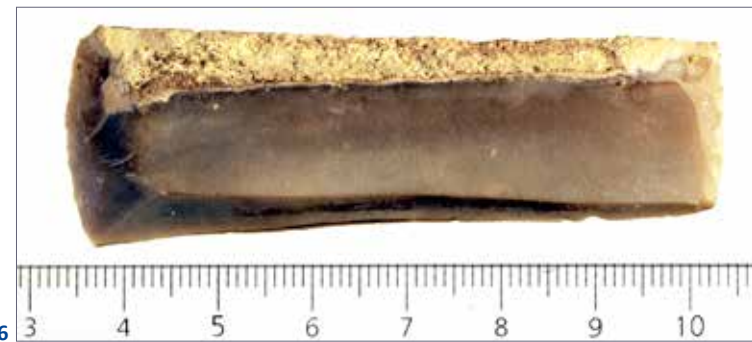
6 Rechteckige Klinge (L: 7 cm, B: 2 cm) (Foto: P. Windszus, DAI Kairo) .

In den nächsten Jahren wird das Forschungsinteresse auf der Untersuchung der späteren Nutzungsphasen liegen. Im Mittelpunkt der neuen Fragestellung sollen somit langfristige Entwicklungsprozesse, Traditionslinien und Transformationsprozesse stehen.