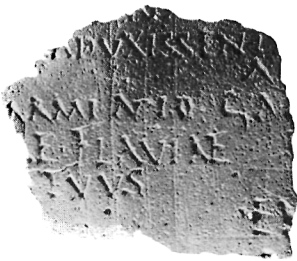
5b I extr.