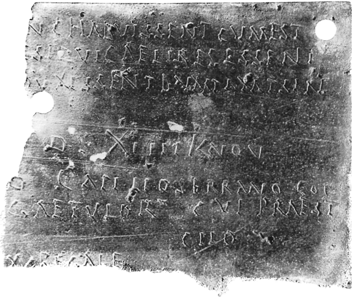
5a II intus