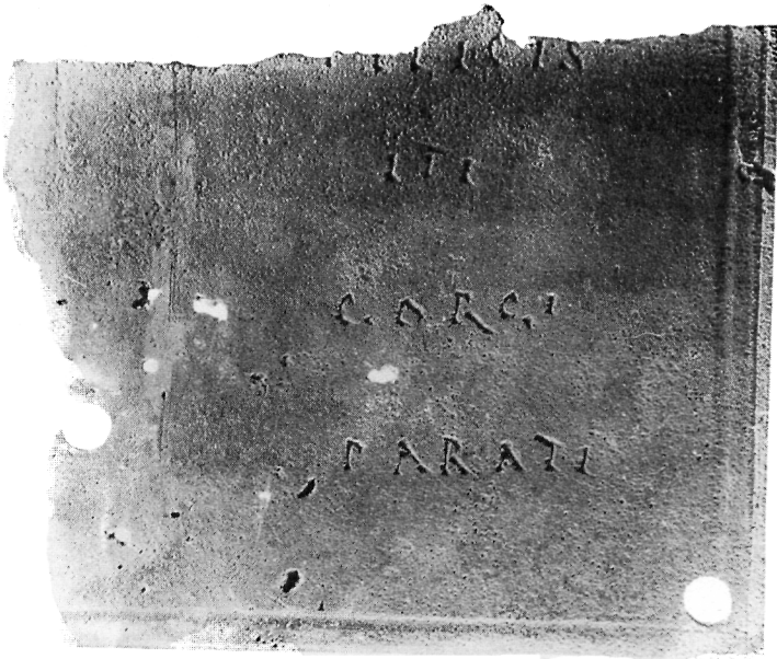
5a II extr.