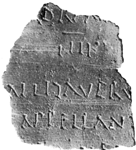
5b I intus