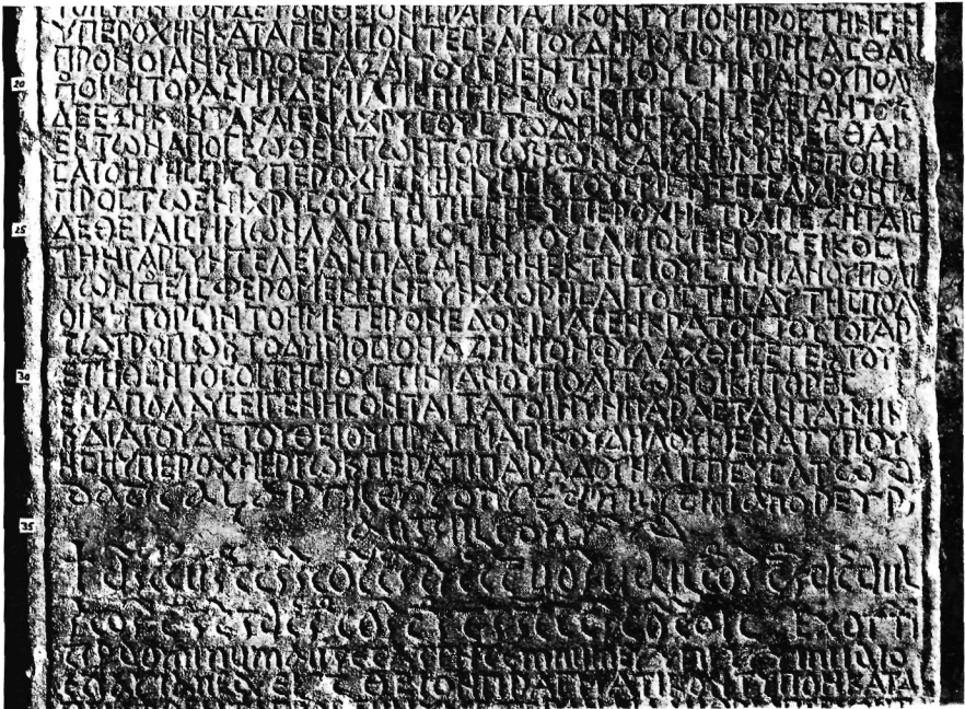
Fig. 3: Rescrit de Justinien, lignes 18–39