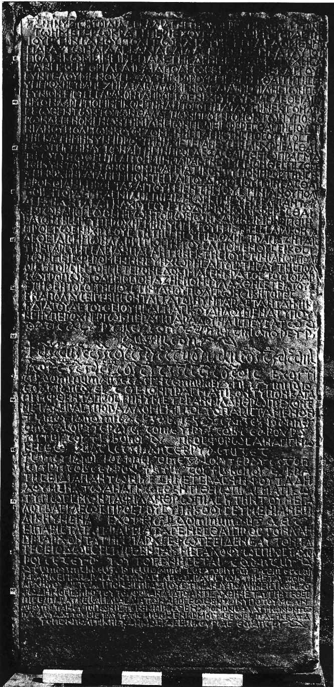
Fig. 1: Rescrit de Justinien découvert à Didymes