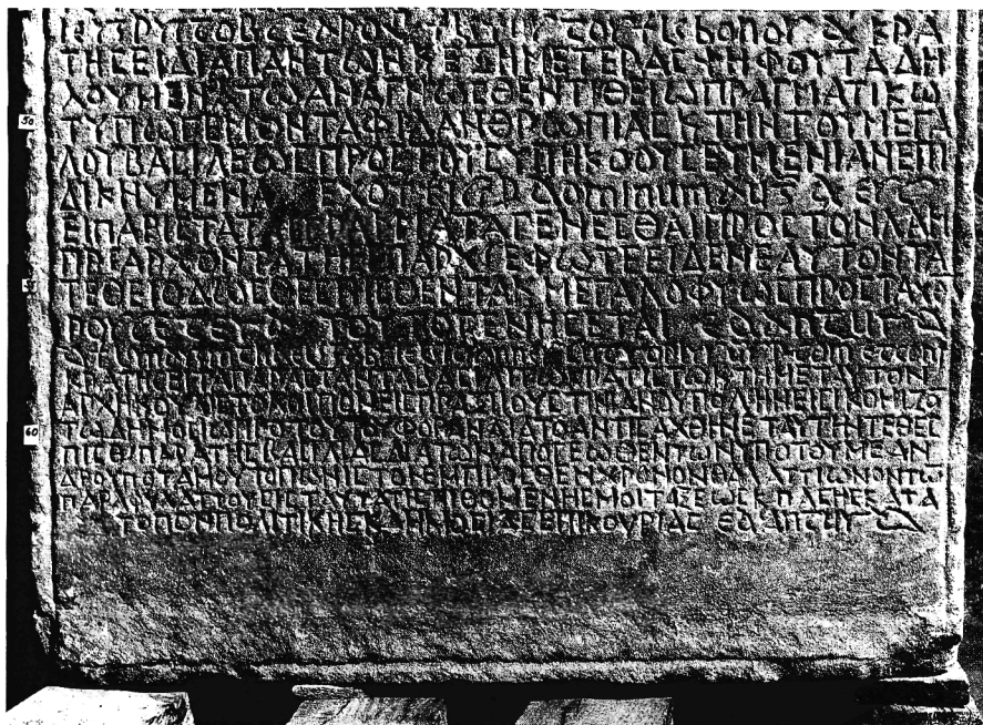
Fig. 5: Rescrit de Justinien, lignes 47–64