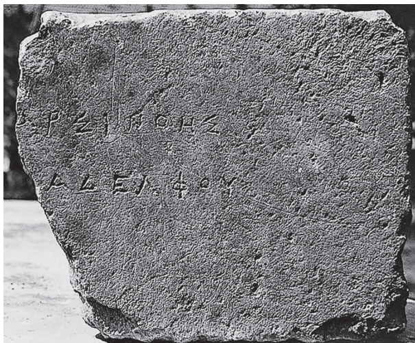
Fig. 3. L'inscription I.Kaunos 54

les Lagides. 71 Dans I.Kaunos 54, la barre horizontale de l'alpha n'est que légèrement arquée, ce qui pourrait témoigner d'une phase intermédiaire entre l'écriture à barre horizontale et celle à barre brisée, adoptée dans I.Kaunos 67 pendant le règne de Ptolémée III, selon notre datation. Une comparaison avec les inscriptions des cités voisines permet de dater la diffusion de l'alpha à barre arquée en Carie pendant la seconde moitié du III e siècle. 72