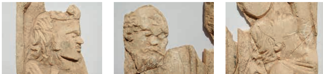
Abb. 4 Perge, Knochenreliefs von der Akropolis. Detailansicht der Köpfe

Klammern oder Bohrlöcher für kleine Dübel oder Nägel erhalten 11 , die der Befestigung dienten. Derartige Vorrichtungen sind an Reliefplatten aus Knochen selten und auch an den Platten aus Perge nicht vorhanden. Es ist daher anzunehmen, daß sie in einen ausgesparten Untergrund eingelassen und verklebt waren 12 . Angesichts des Beifundes zahlreicher teils winziger Fragmente sehr dünner rhomboider Knochenplättchen (max. Länge 3,5 cm), wohl Teile einer Intarsienarbeit, dürfte es sich bei unseren Platten um den Schmuck eines Holzkästchens gehandelt haben.