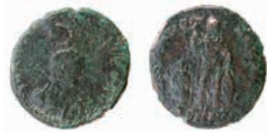
Abb. 7 Perge, Bronzemünze aus Raum 3. Arkadius (383–386 n. Chr.; M. 1 : 1)

vgl. Athen, Benakimuseum Inv. 18880; Marangou 1976, 105 Kat. 102 Taf. 32 a (3./4. Jh. n. Chr.).