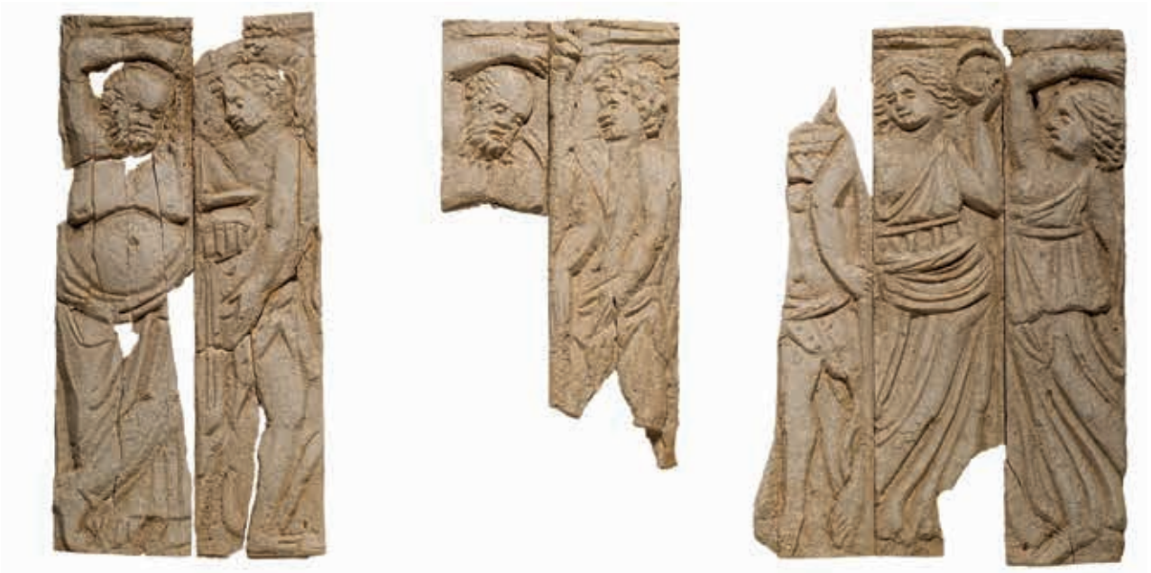
Abb. 5 Knochenreliefs München, Staatliches Museum Ägyptischer Kunst Inv. ÄS 5296 (M. 1 : 2)