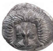
Kat. 2 (M. 1:1)