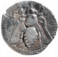
Kat. 5 (M. 1 : 1)