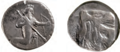
Kat. 9 (M. 1:1)

für die Münzstätte Ephesos genommen. Der Name ist in Ionien jedoch weit verbreitet, so dass dieses Argument wenig stichhaltig ist.