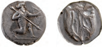
Kat. 8 (M. 1:1)