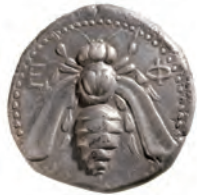
Kat. 6 (M. 1 : 1)