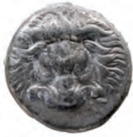
Kat. 4 (M. 2 : 1)