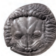
Kat. 1 (M. 1:1)

Die Rückseite passt gut zu den beiden anderen Tetradrachmen von Barrons Klasse X, der Vorderseitenstempel ist jedoch neu. Der Name ist siebenfach für Samos belegt, bisher allerdings nicht auf Münzen, so dass hier ein neuer Magistratsname für die Münzprägung von Samos vorliegt 9 .