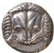
Kat. 3 (M. 1:1)