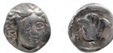
Kat. 7 (M. 2 : 1)

Die Münze ist abgegriffen. Die Vorderseite lässt sich am ehesten mit Ashton 2001, Nr. 18/19 und die Rückseite mit Ashton 2001, Nr. 19 vergleichen, die von R. Ashton 408 bis ca. 390 v. Chr. datiert wurden 13 . Im Hekatomnos-Hort waren 14 Hemidrachmen des Typus Ashton 2001, Nr. 19 vertreten, die mit dieser Münze vergleichbar sind 14 .